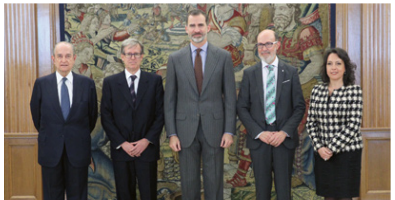
Audiencia privada de S.M. El Rey al galardonado del Premio Pelayo.