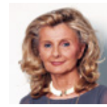
D.ª ISABEL TOCINO BISCAROLASAGA

exPresidente de la Comisión Nacional de Mercado de Valores