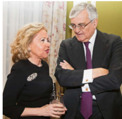
Dña. Consuelo Madrigal Martínez-Pereda, Fiscal de la Sala Segunda del Tribunal Supremo, y D. Eduardo Torres-Dulce Lifante, exFiscal General del Estado.