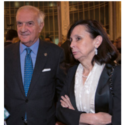
D. Miguel Rodríguez-Piñero y Bravo-Ferrer, Consejero Permanente-Presidente de la Sección Segunda del Consejo de Estado, y Dña. María Emilia Casas Baamonde, Presidente Emérita del Tribunal Constitucional.