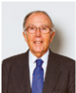
D. MARCELINO OREJA AGUIRRE PRESIDENTE

Académico de la Real Academia de Ciencias Morales y Políticas, exSecretario General del Consejo Europa