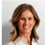
D.ª CRISTINA GARMENDIA MENDIZÁBAL

exVicepresidenta de Desarrollo de Negocio e Integración de Europa de McDonald's