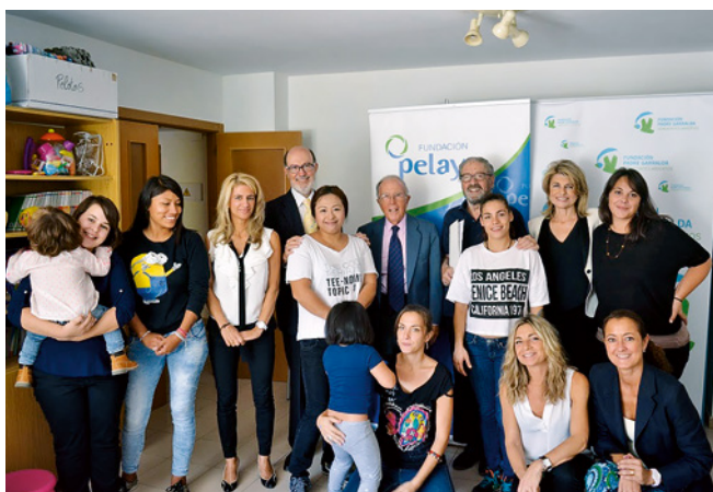
Firma del acuerdo Fundación Padre Garralda Horizontes Abiertos.