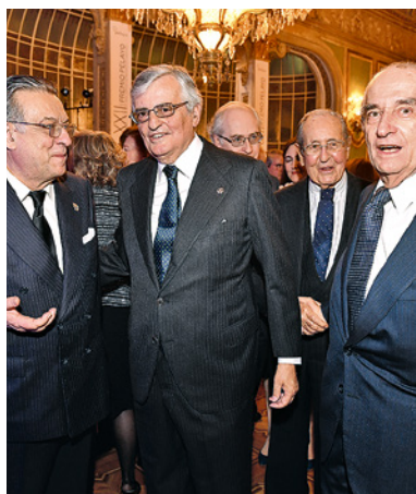
D. Miguel Herrero y Rodríguez de Miñón, Consejojero Permanente de Estado, D. Eduardo Torres-Dulce Lifante, Galardonado del XXII Premio Pelayo y D. Landelino Lavilla Alsina, Presidente del Jurado del Premio Pelayo.