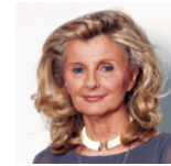
Dª. Isabel Tocino Biscarolasaga

exPresidente de la Comisión Nacional de Mercado de Valores