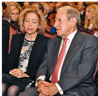
D ña . Consuelo Madrigal Martínez-Pereda, ex Fiscal General del Estado y D. Pascual Sala Sánchez, Presidente Emérito del Tribunal Constitucional.