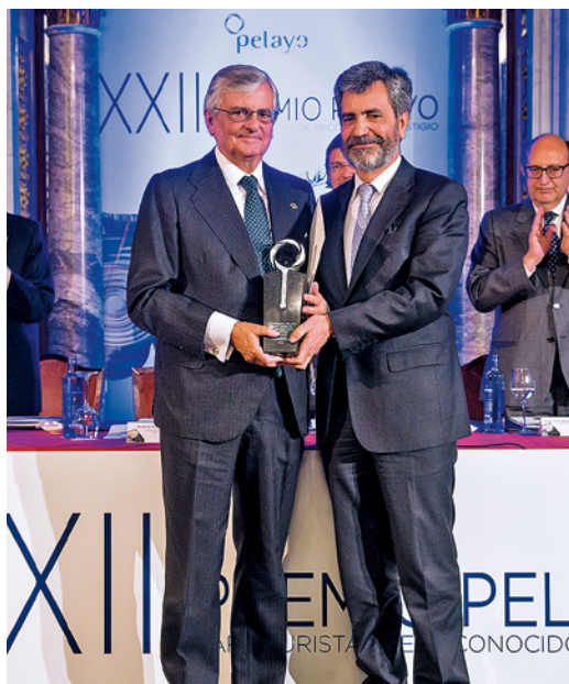
D. Eduardo Torres-Dulce Lifante, Galardonado de la XXII edición y D. Carlos Lesmes Serrano, Presidente del Consejo General del Poder Judicial.