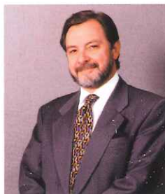
D. Juan Luis Cebrián Echarri Consejero Delegado de Grupo PRISA y Miembro de número de la Real Academia Española.