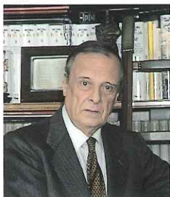
D. Sabino Fernández Campo Presidente del Jurado. Académico de número de la Real Academia de Ciencias Morales y Políticas. Teniente General Honorífico del Cuerpo Militar de Intervención. Licenciado en Derecho.