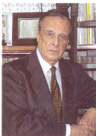
D. Sabino Fernández Campo

Presidente del Jurado. Académico de número de la Real Academia de Ciencias Morales y Políticas. Teniente General Honorífico del Cuerpo Militar de intervención. Licenciado en Derecho.