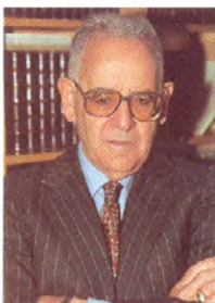
D. Eduardo García de Enterría Martínez-Carande

Catedrático de Derecho Administrativo. Galardonado IV Edición del Premio PELAYO para Juristas de Reconocido Prestigio.