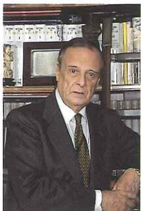
D. Sabino Fernández Campo

Presidente del Jurado. Académico de número de la Real Academia de Ciencias Morales y Políticas. Teniente General Honorífico del Cuerpo Militar de intervención. Licenciado en Derecho.